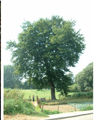
, 20 Août 2003