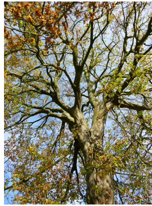
, 08 Octobre 2013