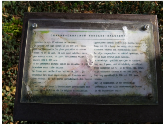
, 08 Octobre 2013