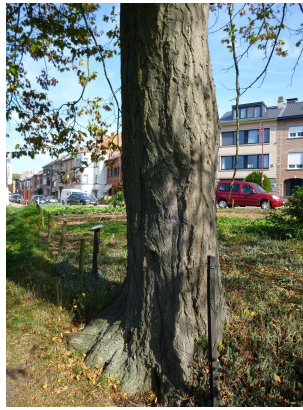
, 08 Octobre 2013