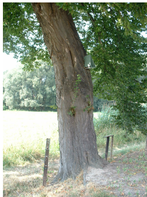
, 20 Août 2003